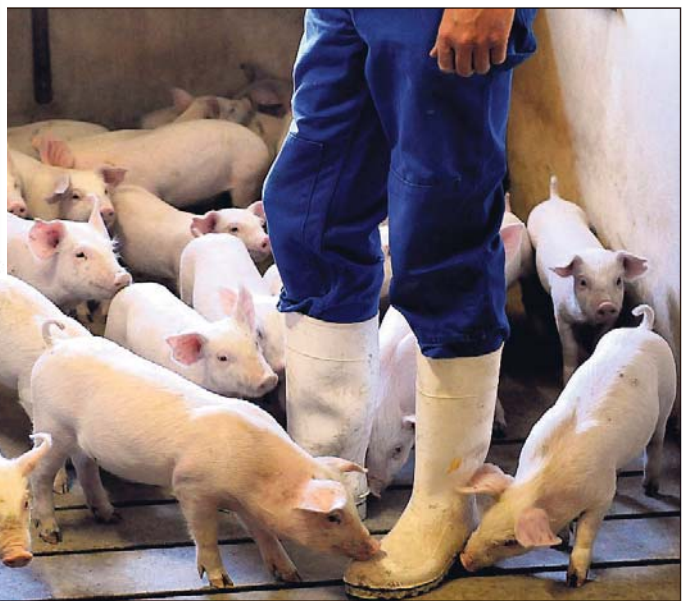
Særligt plante- og svineproducenter og især pelsdyravlerne har en god indtjening, mens det kniber for en del mælkeproducenter.

Den Europæiske Union ved Den Europæiske Fond for Udvikling af Landdistrikter og Ministeriet for Fødevarer, Landbrug og Fiskeri har deltaget i finansieringen af projektet.